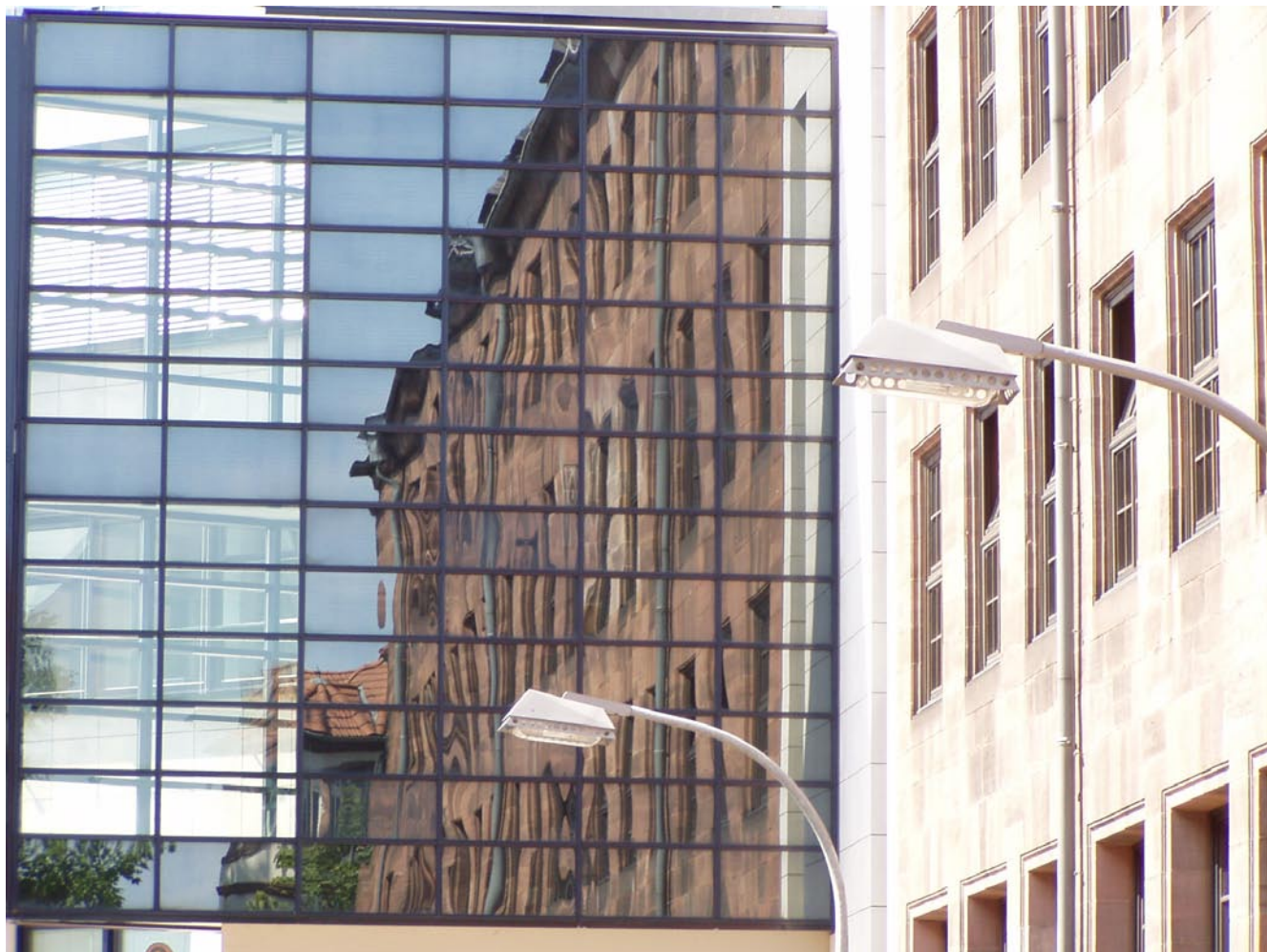
Рис. 1. Оптические искажения в отраженном свете

ным расчетом. То есть это требование (с указанием диапазона температур и давлений) должно обязательно оговариваться при заказе остекления и быть указано в Задании на его проектирование.